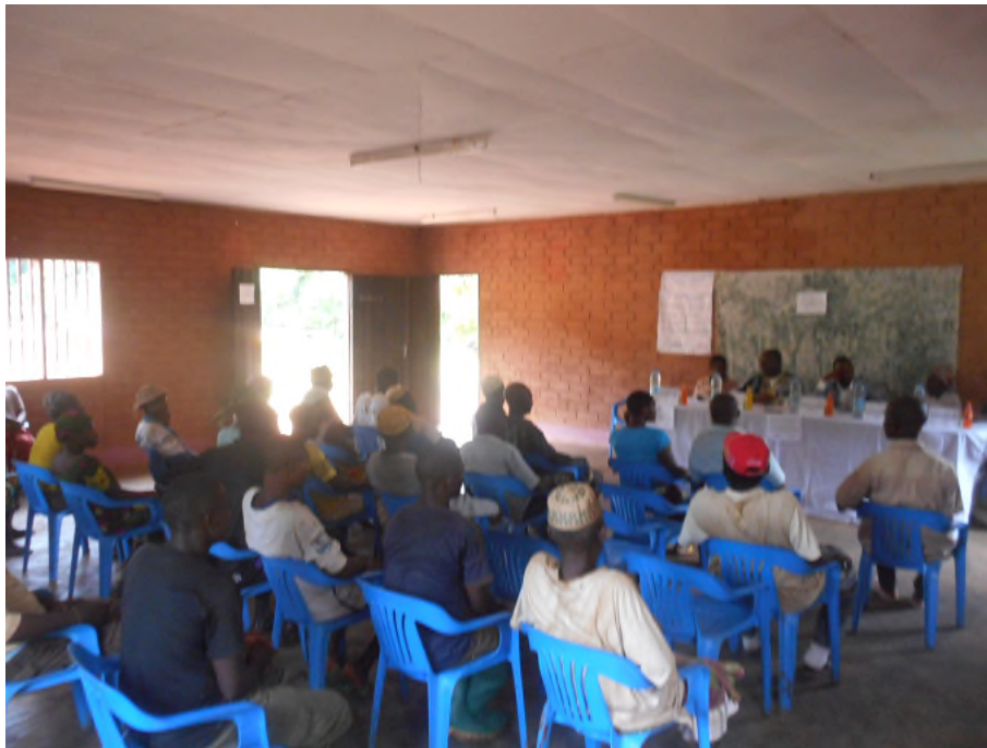
Vue partielle des intervenants lors du bilan des 10 ans de la DNUDPA chez les Bedzang

JOURNEE INTERNATIONALE DES PEUPLES AUTOCHTONES :LES BEDZANG DE LA PLAINE TIKAR UNE FOIS DE PLUS AU CŒUR DE L'ÉVÉNEMENT