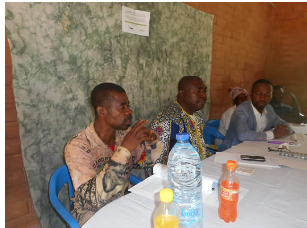
Photo N°3 : vue partielle du panel lors des échanges sur le bilan des 10 ans de mise en œuvre de la DNUDPA chez les Bedzang (9 août 2017)

La méthodologie a consisté à présenter le thème central de la journée internationale, puis, les sous thèmes à développer par chaque panéliste. 10 minutes ont été consacrées à chaque présentation et 20 minutes pour les échanges. Après chaque présentation, le modérateur donnait la parole au public constitué majoritairement des Bedzang afin que ces derniers puissent à leur tour contribuer sur chaque aspect.