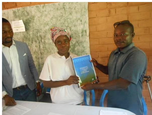
Photo N°8 : remise de la DNUDPA à une animatrice Bedzang (Ngoumé, 9 août 2017)