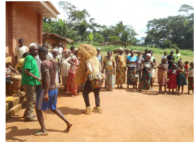
Photo N°6 : un groupe de danse Bedzang au terme du défilé (9 août 2017)