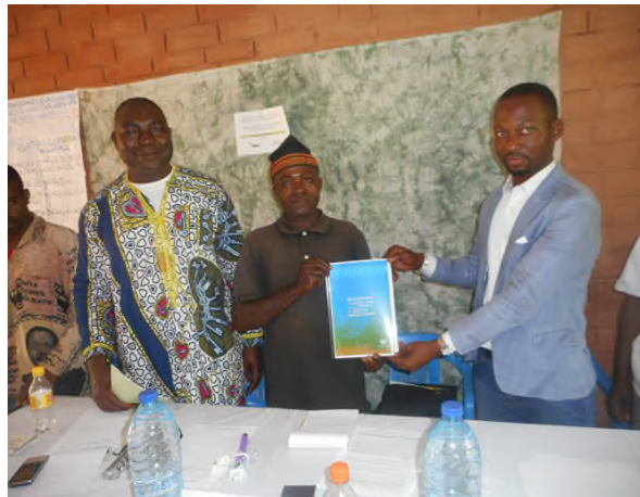
Photo N°5 : remise de la déclaration au chef de la communauté Bedzang de Ngoumé (9 août 2017)