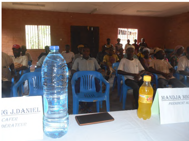
Photo N°7 : les Bedzang participent aux échanges sur le bilan des 10 ans de la DNUDPA

• L'éducation des enfants étant le seul et véritable moyen pour prétendre à un développement social, culturel et économique des Bedzang, il est important que les pouvoirs publics et les partenaires au développement mettent un accent sur la formation des enfants qui constitueront la relève de demain. Le rôle de l'Etat et des partenaires déterminés, il est tout aussi nécessaire pour les parents d'envoyer leur enfant à l'école et s'assurer auprès des enseignants de leur performance.